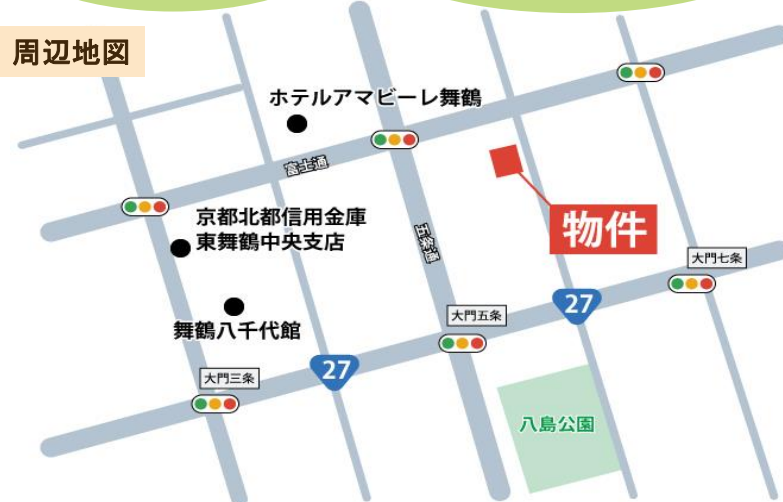
マルチハザード情報